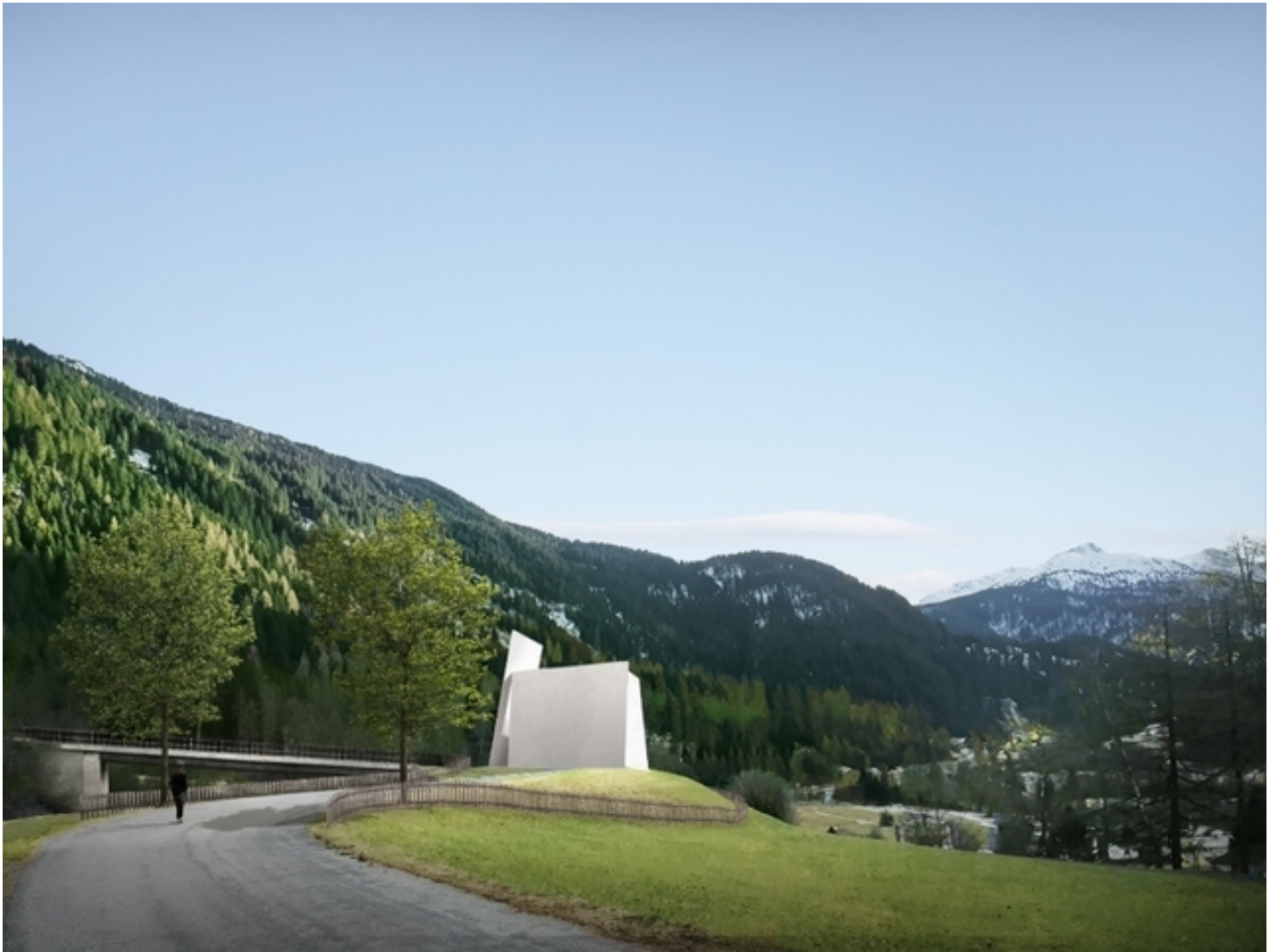
Besinnung im «Kartenhaus» unmittelbar neben der Autobahn: Visualisierung der geplanten Kapelle bei Andeer (GR). Foto: Herzog & de Meuron

Die Stararchitekten haben in Andeer GR ein radikal reduziertes Gotteshaus entworfen, das sogar Atheisten zur Einkehr einladen könnte.